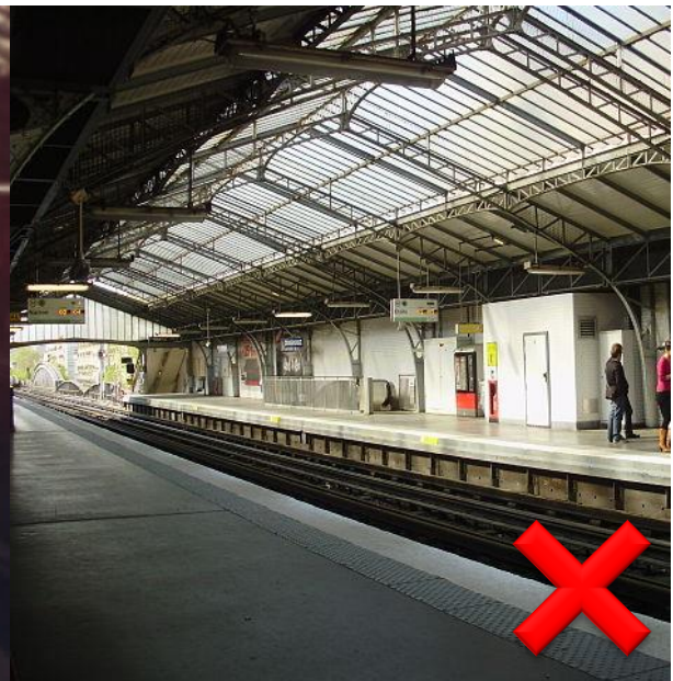
Fot. Geralix, CC BY-SA 3.0.